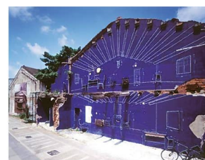
打開連合設計事務所 《Blue Print》2004

*参加アーティスト及び公演団体等は2013年2月8日現在のものです。また、掲載写真は、参考作品等です。