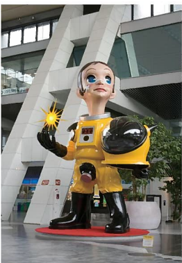
ヤノベケンジ《サン・チャイルド》2011