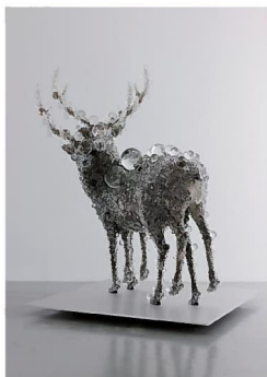
名和晃平 《PixCell- Double Deer#4》2010