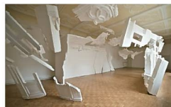
ソ・ミンジョン 《Summe im Augenblick》2010