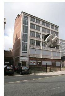
リチャード・ウィルソン 《Turnig the Place Over》2007 commissioned by Liverpool Biennial