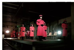
やなぎみわ「案内嬢プロジェクト」 鉄道芸術祭vol.2「駅の劇場」 (アートエリアB1) 2012